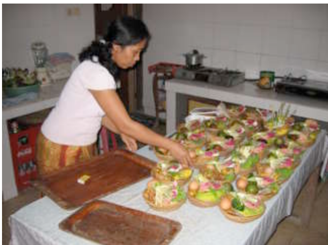
Met grote zorg klaargemaakte offergaven...