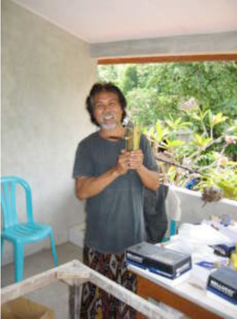
Het hang- en sluitwerk, tegels en cement voor de eerste etage