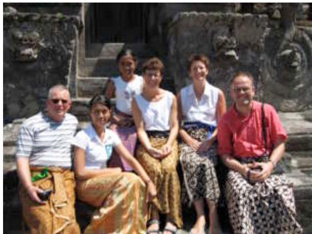
Voor een tempel trek je je mooie kleren aan...