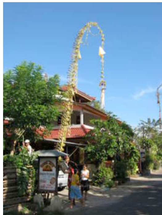
De Penjor staat