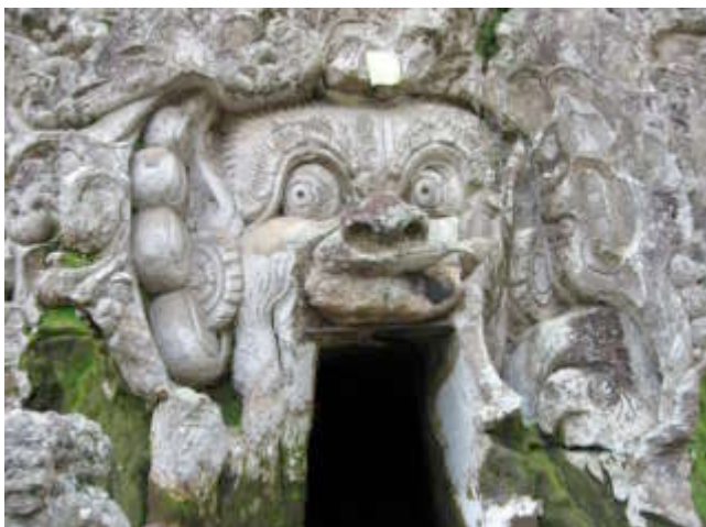
Hindoeïstisch heiligdom Goa Gajah (olifantengrot)