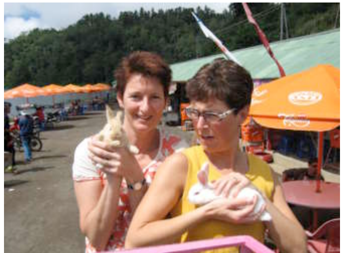
Kelinci te koop bij Danau Batur

Mangku brengt ons de volgende dag, dinsdag 25 april, naar Ubud, waar we een auto huren voor onze trip over Bali.