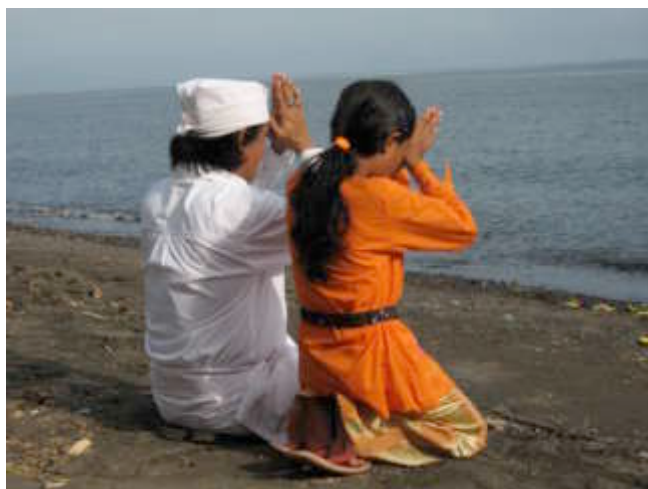
Bidden voor de god van de zee