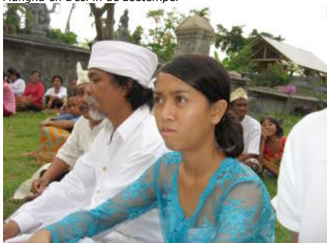
Mangku en Desi in de zeetempel

Vooraf de samenzang is prachtig, Santi, Santi, Santi. Het bidden met de handen samen boven het hoofd, soms wel, soms niet met bloemblaadjes tussen de vingers geklemd. Er wordt wierrook gebrand en de dienst eindigt met het sprenkelen met heilig water: drie keer drink je het van je handen op, de vierde keer strijk je het in je haar. Na het laatste gebed volgen nog de mededelingen over de komende ceremonies. Stijf van anderhalf uur lotuszit lopen wij in de stroom tempelgangers terug.