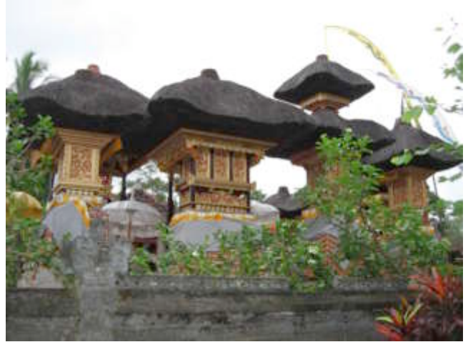
Huistempels in Keliki