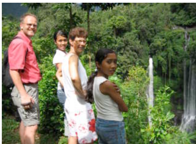
Mooi, de air terjun