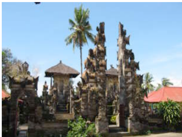
De Pura dalem van Jacaraga