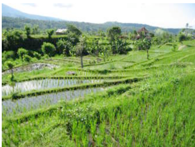
Magnifieke rijstvelden rond tirta