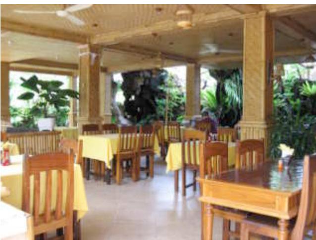
Tien tafeltjes in het ruime restaurantgedeelte