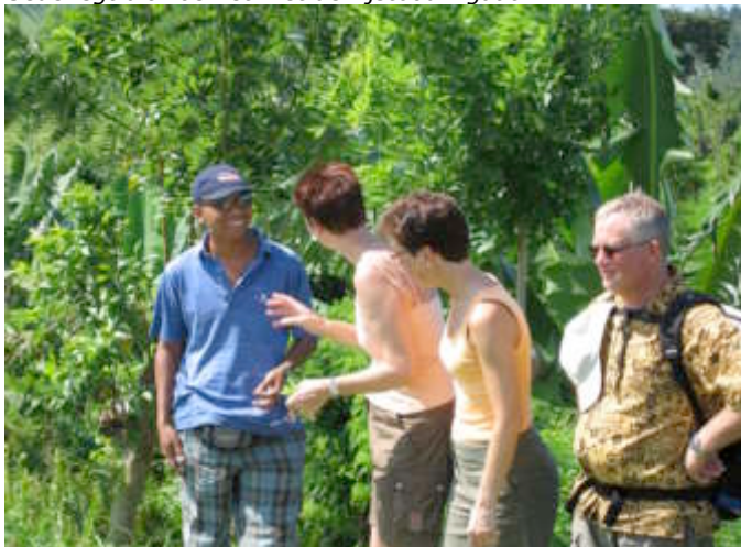
Gede legt uit hoe het met de rijstbouw gaat