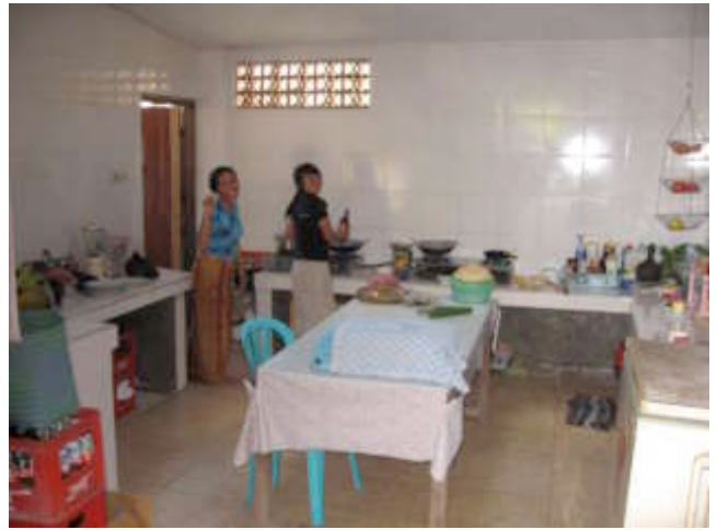
Ayu en Ilu in de nieuwe keuken