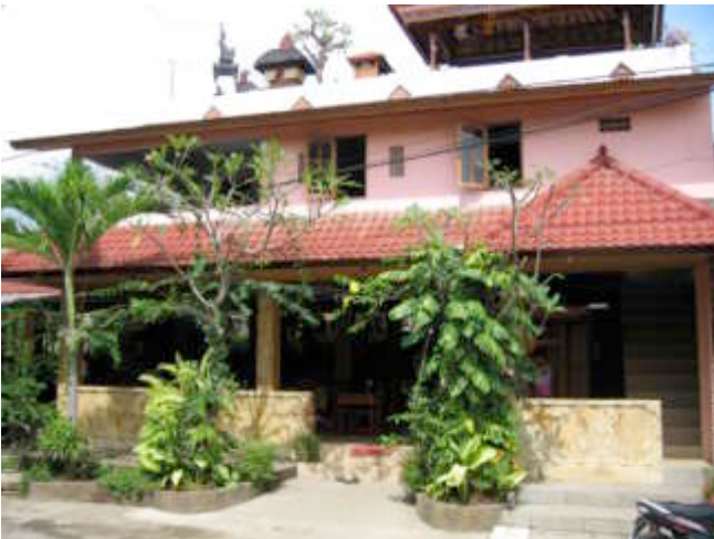
De entree en het terras voor 'lookie, lookie'