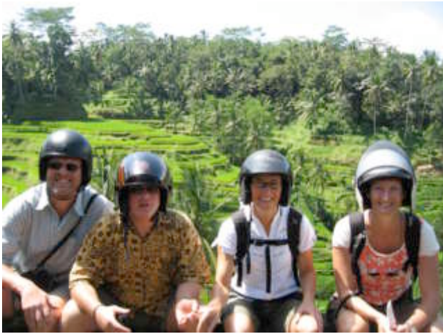
Vier kleine willempies...