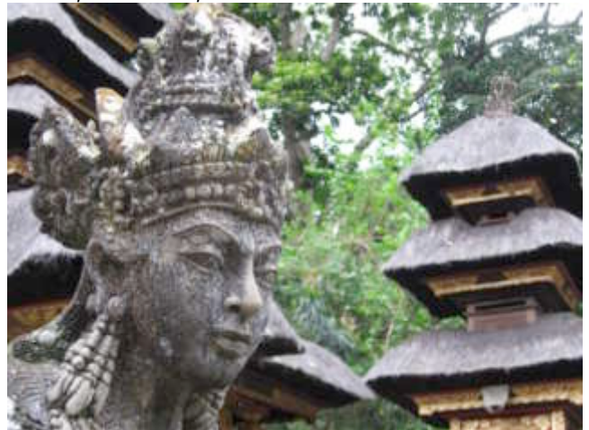
De tempel van Campuan