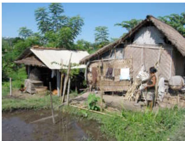
Eenvoudige bamboehuisjes komen ook nog voor...