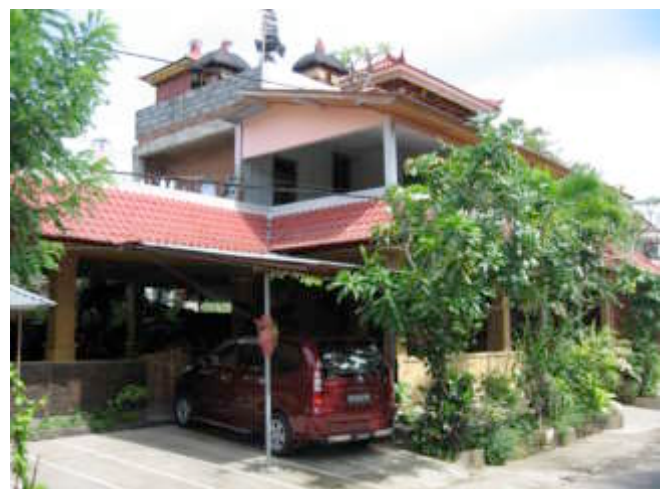
Vooraanzicht Sunset Ayu Restaurant & Bungalows