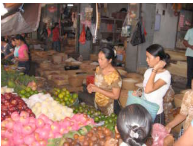
Nee, er zijn geen avocado's vandaag!