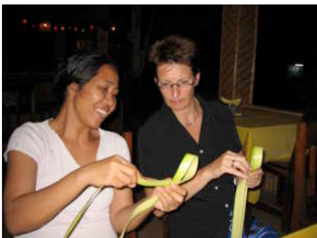
Valt niet meer, lontongbakjes vouwen

Arjen: Galungan vindt om de 210 dagen plaats, in de elfde week van de Balinese cyclus. Het is het feest ter ere van de schepping van het universum. De periode van festiviteiten bereikt een hoogtepunt in Kuningan, het Balinese Allerheiligen, aldus de Capitoolgids Bali & Lombok.