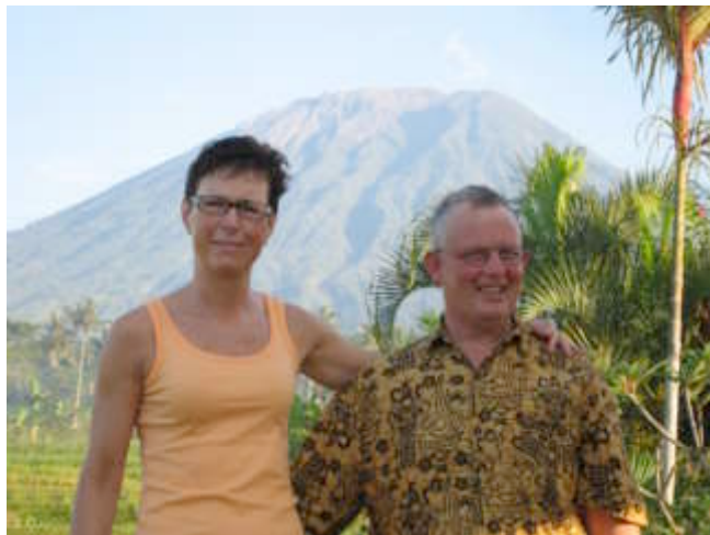
De jarige met trouwe echtgenoot voor de Gunung Agung