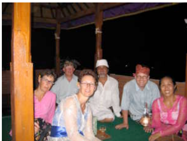
Eten tijdens Galungan op de bale-bale bij de huistempel