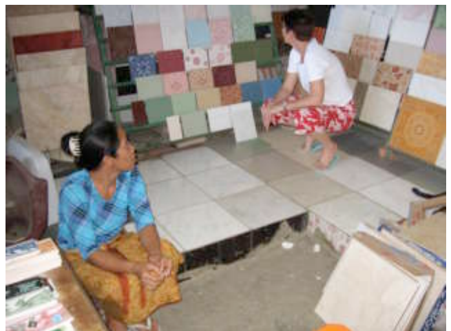
Tegels voor de kamar mandi