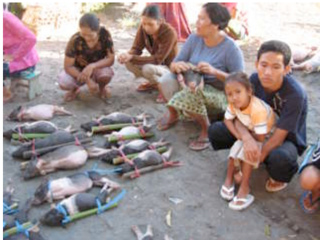
Daar liggen ze voor de verkoop...