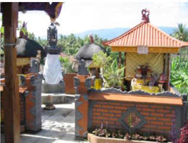
De huistempels op de 2 e etage

Uiteindelijk is het andere spul ook wakker en gaan we ontbijten, empat (vier) nasi goreng! Wat kan Ayu toch heerlijk koken. Na het ontbijt lopen we met Mangku door het straatje naar het strand. Mangku loopt trots met ons mee. Meisjes en vrouwen komen naar ons toe en willen van alles aan ons verkopen.