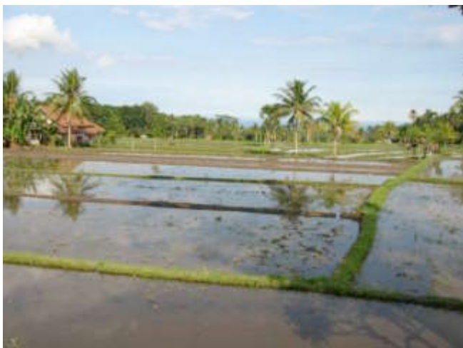
De rijstvelden rond Budakeling