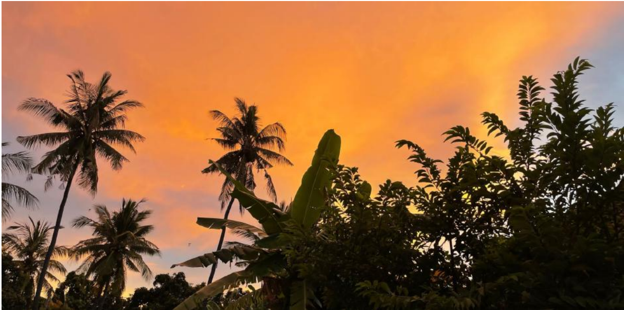
Zonsondergang op Bali