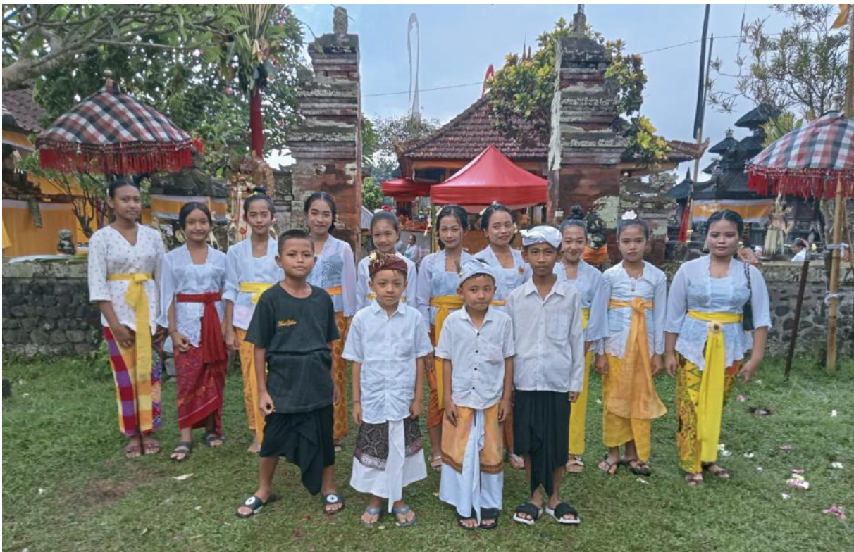
De schoolkinderen in Budakeling